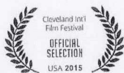
Kresnik: Ognjeno izročilo