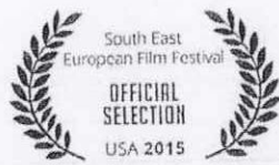
Kresnik: Ognjeno izročilo