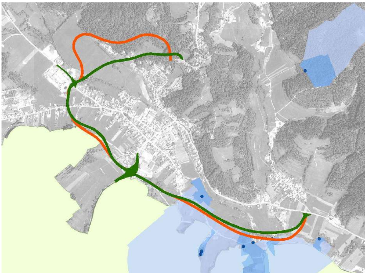
Slika 2: Potek variantnih rešitev obvozne ceste naselja Sodražica (varianta A = zelena linija; varianta B = oranžna linija) in varstveni režimi (rumeno območje = Natura območje; modro območje = VVO; modra točka = vodno zajetje).

Zaradi upoštevanja varstvenih, varovanih, zavarovanih, degradiranih in drugih območjih, na katerih je zaradi varstva okolja (območja poplavne nevarnosti, plazljiva in erozijsko nevarna območja), ohranjanja narave (Natura območja, območja naravnih vrednot, ekološko pomembna območja), varstva naravnih virov (vodna zajetja, vodovarstvena območja, najboljša kmetijska zemljišča) ali kulturne dediščine predpisan poseben pravni režim in je pomemben pri prostorskem načrtovanju ter upoštevanja splošnih in posebnih smernic NUP (MKGP, ZRSVN, DRSV, DRSI), je kot naustrežnejša ocenjena varianta A .