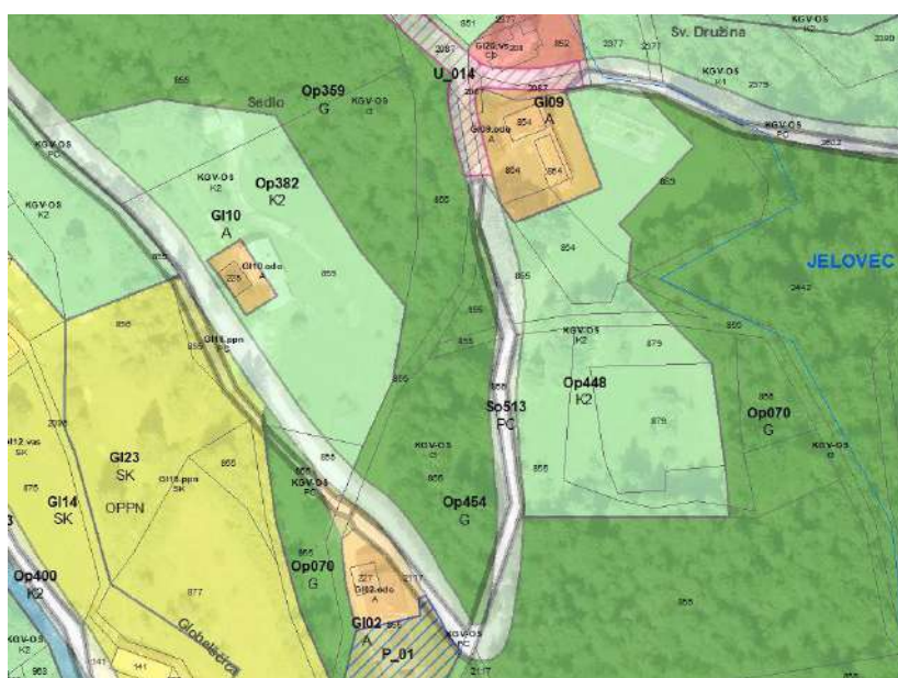
Slika 1: Primer neskladja v grafičnem delu izvedbenega dela OPN S 07.