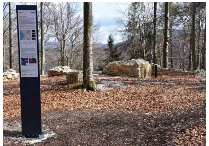
Ostanki rimske zapore nad vasjo Benete na vzpetini Drnik. Stražni stolp in del zapore je arheološko zaščiten in opremljen z informacijskim panojem.

Ostaline poznorimske zapore Claustra Alpium lularum bi lahko predstavljale pomembno turistično ponudbo občine. Gre za eno največjih arheoloških ostalin tistega časa. Zapora je bila dokončno zgrajena v 3. in 4. stoletju našega štetja in naj bi branila takratni rimski imperij pred vdori barbarskih ljudstev. V občini Sodražica in neposredno na meji ali ob meji z občino Bloke lahko vidimo ostaline zidu na treh mestih: najprej na vzpetini, imenovani Drnik, na meji z občino Bloke, kjer lahko sledimo ostaline zidu v skupni dolžini približno 600 m. Del zidu in obrambnega stolpa je bil pred leti arheološko zaščiten in opremljen z informacijskim panojem.