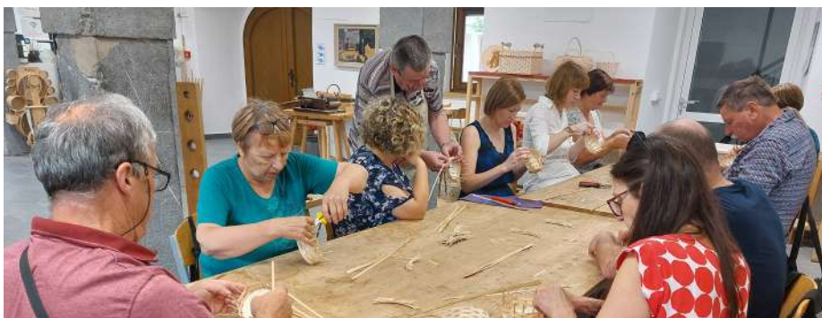
Rokodelski center Ribnica – večina se je prvič preizkusila v pletenju košaric.

Kočevsko! Sledil je iskri voden sprehod do Tržnice Kočevje, trgovine Zakladi Kočevske in Podstrešnice, kjer smo videli, kako uspešno spodbujajo uporabo zdravih in lokalnih pridelkov/izdelkov in spodbujajo ponovno uporabo različnih predmetov, ostale izdelke, ki so del kolektivne blagovne znamke O, Kočevsko! pa smo si ogledali v Hostlu Bearlog. Sprehod smo zaključili pri novem skate parku, kjer smo sklenili, da podoben ogled naslednjič organiziramo še v občinah, ki jih tokrat nismo obiskali.