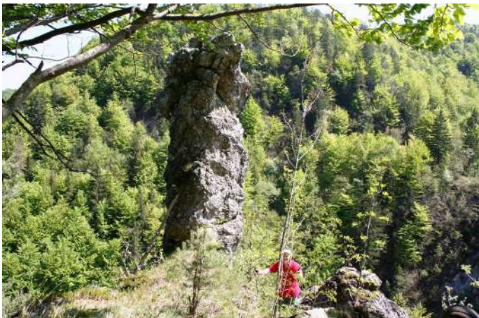
Škofek, »Mateča deklica«, kamnita igla nad sotesko Kadice

Sodraška pešpot – SP je krožna, z začetkom in zaključkom v Sodražici, namenjena je, da pohodnik obhodi občinsko mejo. Ker je občina majhna, jo dobro pripravljen pohodnik sicer lahko obhodi v približno 16 urah. To sicer ni najpomembnejši vidik, saj smo z označitvijo krožne poti okoli Sodražice želeli pohodnikom pokazati kar največ naravnih in kulturnih znamenitosti, ki jih srečamo na ali ob poti okoli Sodražice, teh pa je kar nekaj. Zato je smiselno, da pot opravimo v več krajših etapah in si na ta način dodobra ogledamo vse, kar je značilno za občino. SP je, z izjemo nekaj manjših odsekov, nezahtevna in relativno varna.