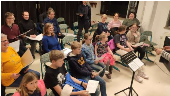
Skupna vaja družinskega in župnijskega pevskega zbora Sodražica.

sodelovanje z župnijskim zborom in smo tako pod njenim vodstvom skupaj zapeli na primer za veliki teden in za praznik sv. Florijana. Petje nas povezuje, še bolj pa takrat, ko ga darujemo Bogu v čast. Vse tiste, ki bi radi bili del naše zgodbe, pristrčno vabimo v našo družbo! Sodeluje lahko vsak, ki ima veselje do petja in druženja. Pridružite se nam in poskusite!