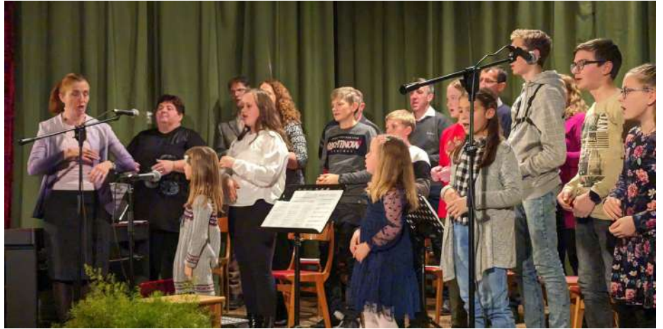
Božični koncert v Starem trgu pri Ložu.

Poleg petja pri maši v domači župniji vsak mesec smo lani decembra skupaj z ljudskimi pevkami iz Starega trga pri Ložu pripravili čudovit božični koncert v Starem trgu. Prepevali smo tako božične kot tudi druge slovenske pesmi, pri tem pa so naši otroci spremljali petje na klavirju, violončelu, violini, klarinetu, saksofonu in harmoniki, starši pa na kitari. Takoj po veliki noči pa smo se odpravili na Hrvaško, v Prezid, kjer smo sodelovali pri srečanju cerkvenih pevskih zborov iz Gorskega Kotarja in Slovenije. Z družinskim zborom in ob spremljavi inštrumentov smo zapeli dve velikonočni pesmi, večer pa je obogatilo druženje z rojaki, ki živijo na Hrvaškem. Vrhunec sezone smo doživeli, ko so otroci sodelovali na sreča-