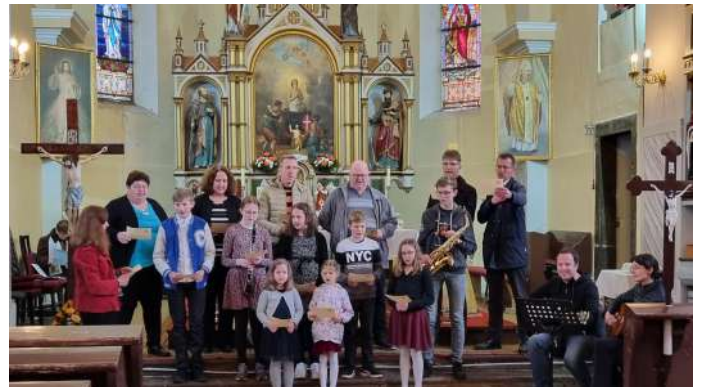
Nastop na srečanju slovenskih cerkvenih zborov iz Gorskega Kotarja in Slovenije v Prezidu