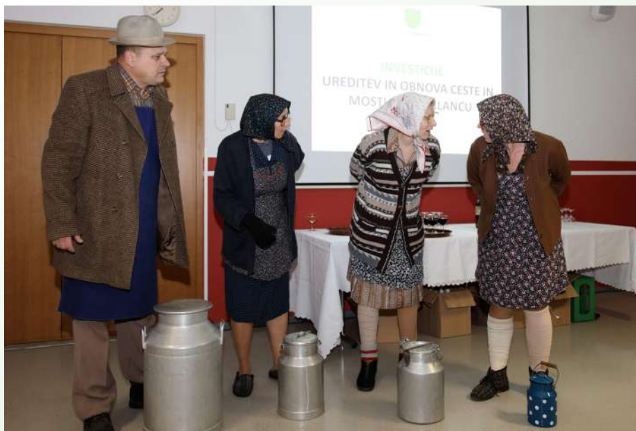
Radio Mlajku na novoletnem sprejemu župana

ob državni cesti pomembna, zato gredo naša prizadevanja in pričakovanje do države, da se zgradi celotno omrežje, kot je predvideno v idejni zasnovi. Spremembe, dobre in slabe, so pač del življenja – tako kakor negotovost in podra-