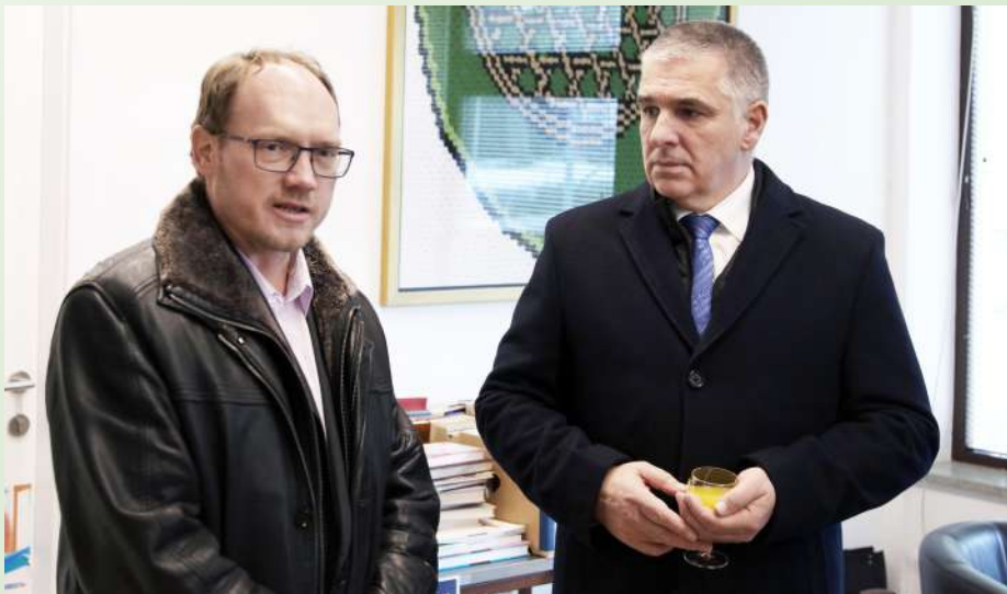
Obisk predsednika državnega sveta v Sodražici

Z rastjo plač, ki se je zgodila po sklenitvi dogovora med vlado in reprezentativnimi sindikati v javnem sektorju, se je hotelo odgovoriti na pomanjkanje ustreznega kadra, ki vse bolj išče svoje priložnosti izven sektorja. Po drugi strani pa to prinaša višje stroške za izvajalce javnih služb in končno višje cene za te storitve uporabnikom. V prvih mesecih novega leta se tako veselimo novih višjih plač, v naslednjih mesecih pa bo temu žal sledil val podražitev, od različnih komunalnih storitev do vrtca. Zaradi vse dražjih storitev v gradbeništvu smo bile občine prisiljene zviševati tudi druge lastne vire, iz katerih se financirajo investicije in investicijsko vzdrževanje javnih objektov in komunalne infrastrukture, ki se po zakonu ne pokrivajo iz sredstev, ki jih občinam za njihovo delovanje namenja država (povprečnina) ali uporabniki (različne omrežnine). Med te dvige obdavčitve sodi tudi sprememba odmere nadomestila za uporabo stavbnega zemljišča. Ta dajatev je bila v naši občini že sicer zelo nizko postavljena. Upošteva jo rast stroškov v gradbeništvu, ni več zagotavljala izvedbe